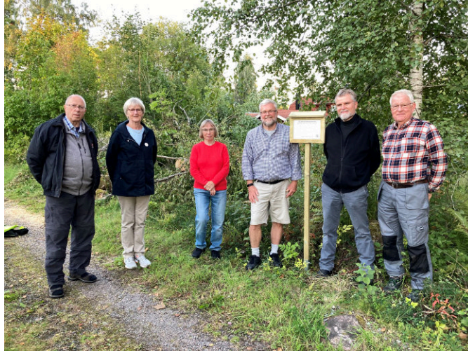
Uppättning av infoskylt vid soldattorp

boplatser under indelningsverkets tid, cirka 1680 till 1900. Mycket dokumentation finns i skrifter som tidigare givits ut av hembygdsföreningen. Mer information har bland annat samlats in ur